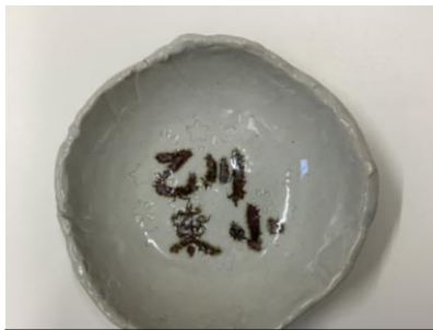
陶芸の先生の作品

みんなでバスに乗って、さわやか教育展の見学に行ってきました。2チームに分かれて、見学をしました。展示されている自分たちの作品を見つけて、とても嬉しそうでした。焼き上がったお皿を見て、家に持って帰ったら、何を入れて食べようか考えて楽しみにしている子もいました。